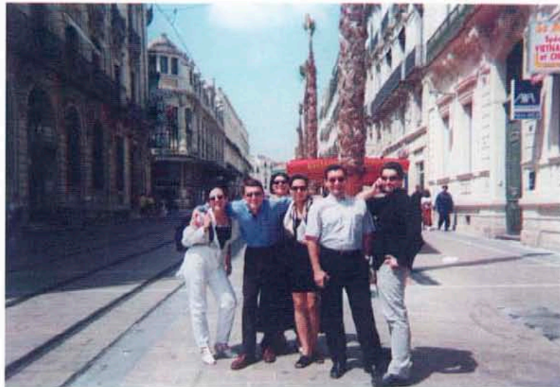
Една от главните улици на Монпелие

Илиян Шандурков, секретар на РАК - София